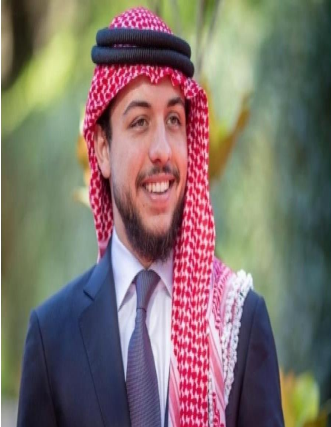
حضرة صاحب السمو الملكي الأمير الحسين بن عبد الله الثاني ولي العهد حفظة الله ورعاه