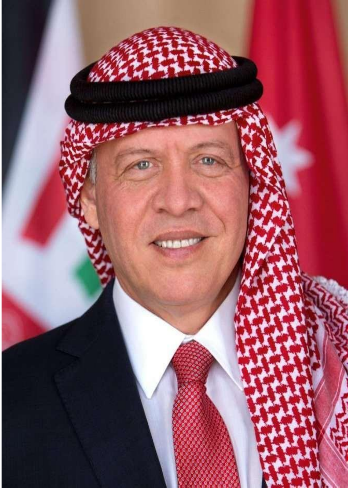
حضرة صاحب الجلالة الملك عبدالله الثاني بن الحسين حفظة الله