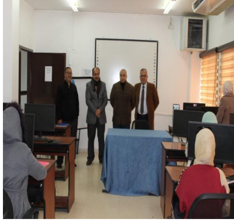
تسليم الشهادات لعدد من الطلبة المشاركين في برنامج الورش التدريبية المجانية