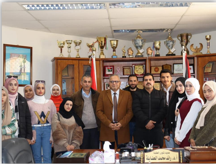
ورشة مهارات التصوير الفوتوغرافي